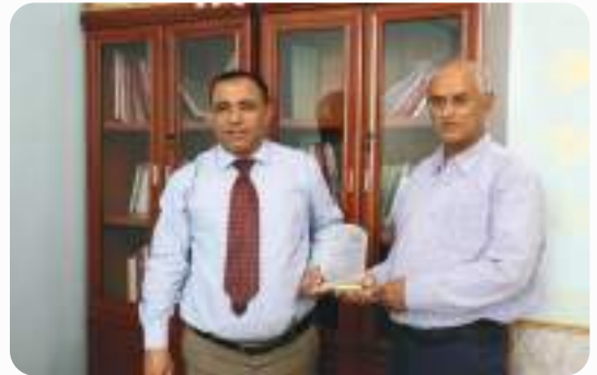
تكریم مؤسسة الرفقاء