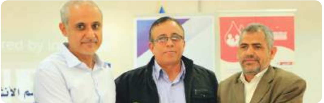
المشاركة في تدشين المهرجان المجتمعي السادس لمرضى الفشل الكلوي والسرطان بجامعة العلوم والتكنولوجيا