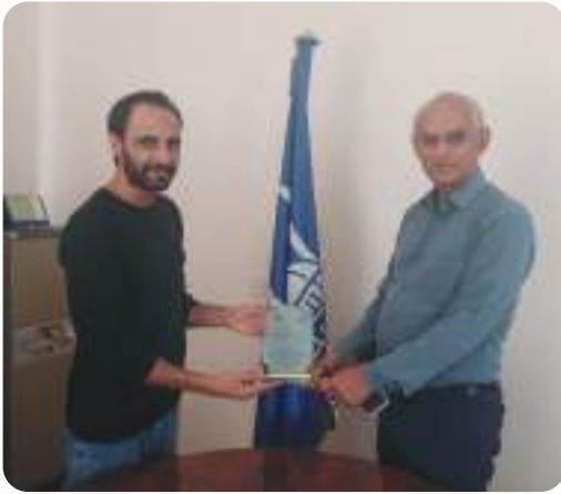
تكریم منظمة الإغاثة الاسلامية