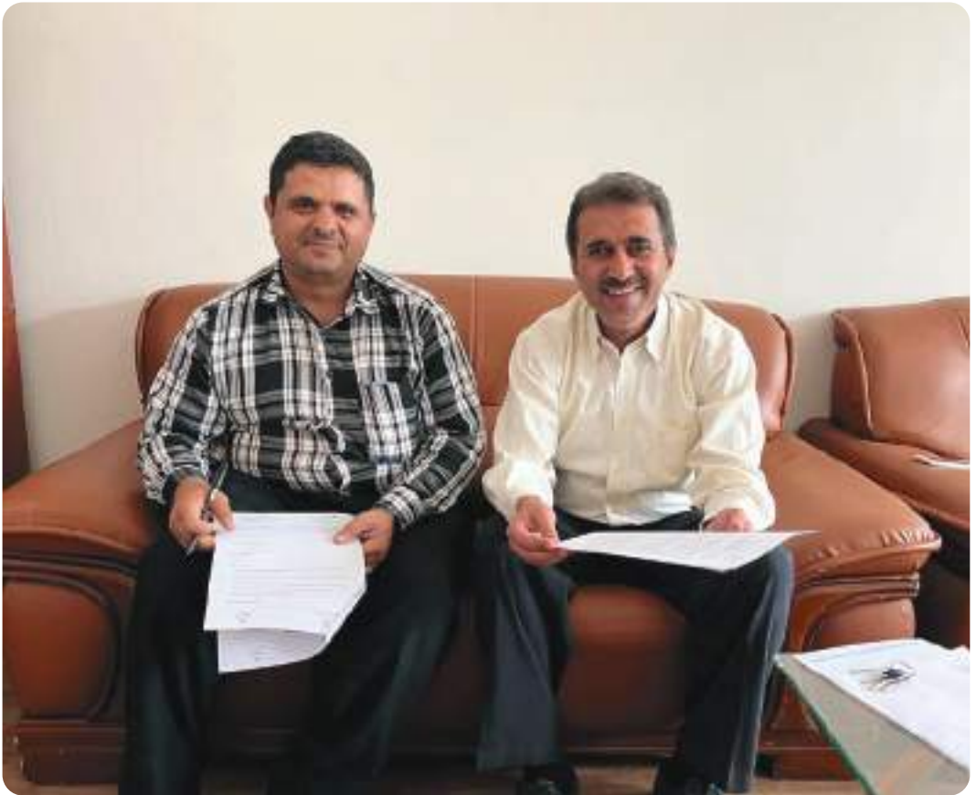
توقيع اتفاقية مع المؤسسة الوطنية لمكافحة السرطان