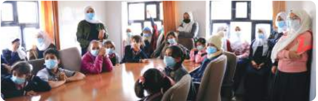
زيارة زهور وبراعم مدارس الرشيد