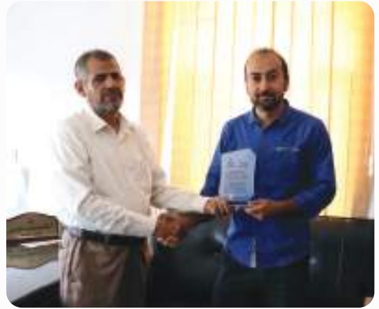
تكریم منظمة الهجرة الدولية