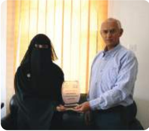
تكریم منظمة هیومنتی للإغاثة والتنمية