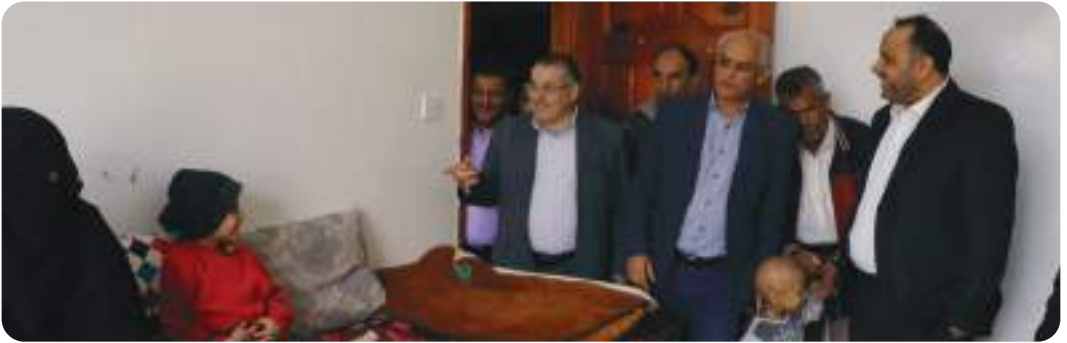
زيارة وكيل وزارة الشؤون الاجتماعية الأستاذ/ علي سعيد الزرامي