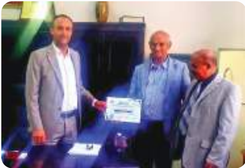
رئيس هيئة المستشفى الجمهوري يكرم المؤسسة