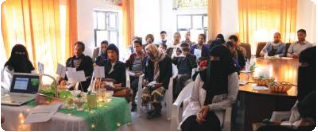
زيارة طالبات قسم التغذية العلاجية في جامعة الرازي