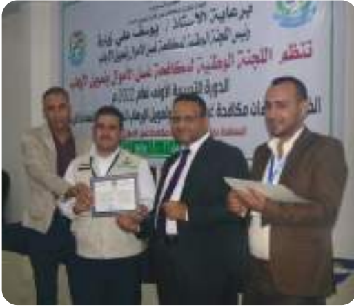
المشاركة في دورة إجراءات مكافحة الفساد