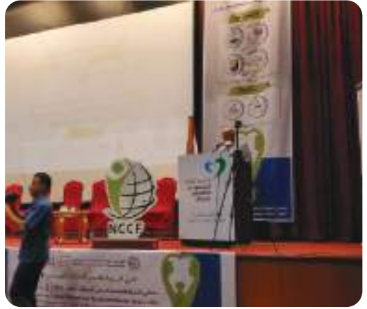
المشاركة في ملتقى الرعاية الاجتماعية لمرضى السرطان